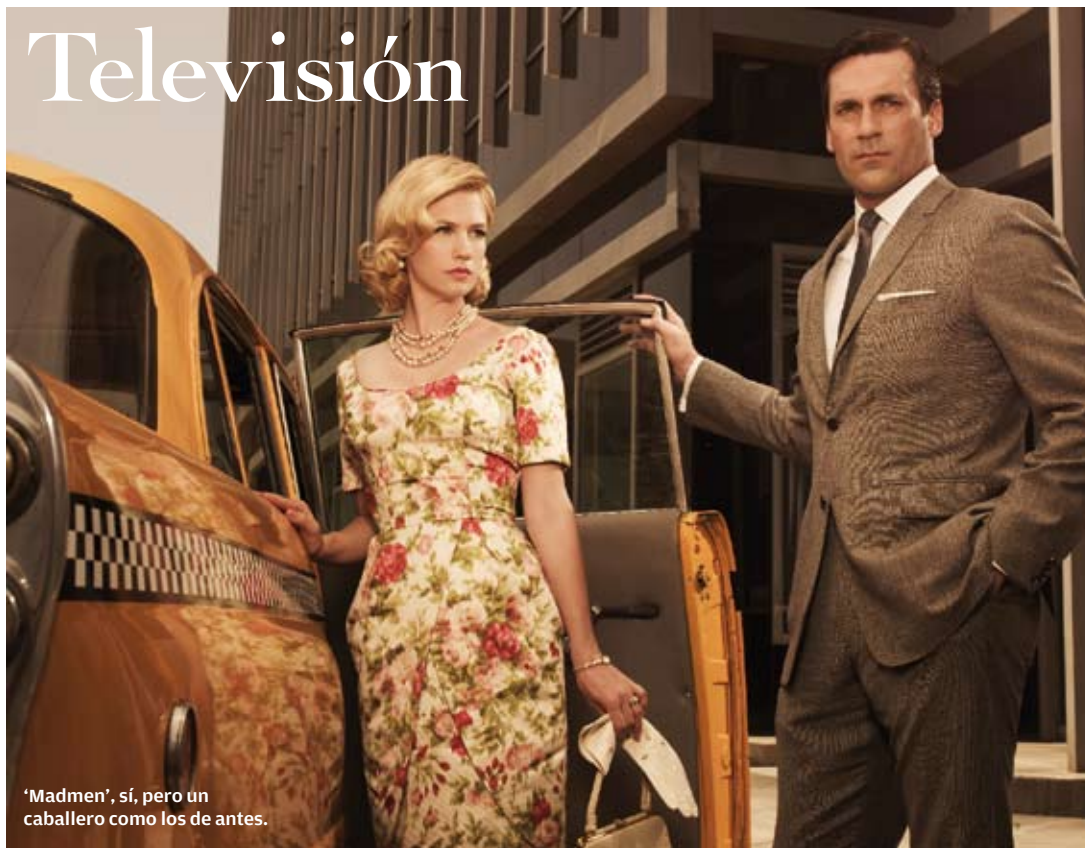
'Madmen', sí, pero un caballero como los de antes.